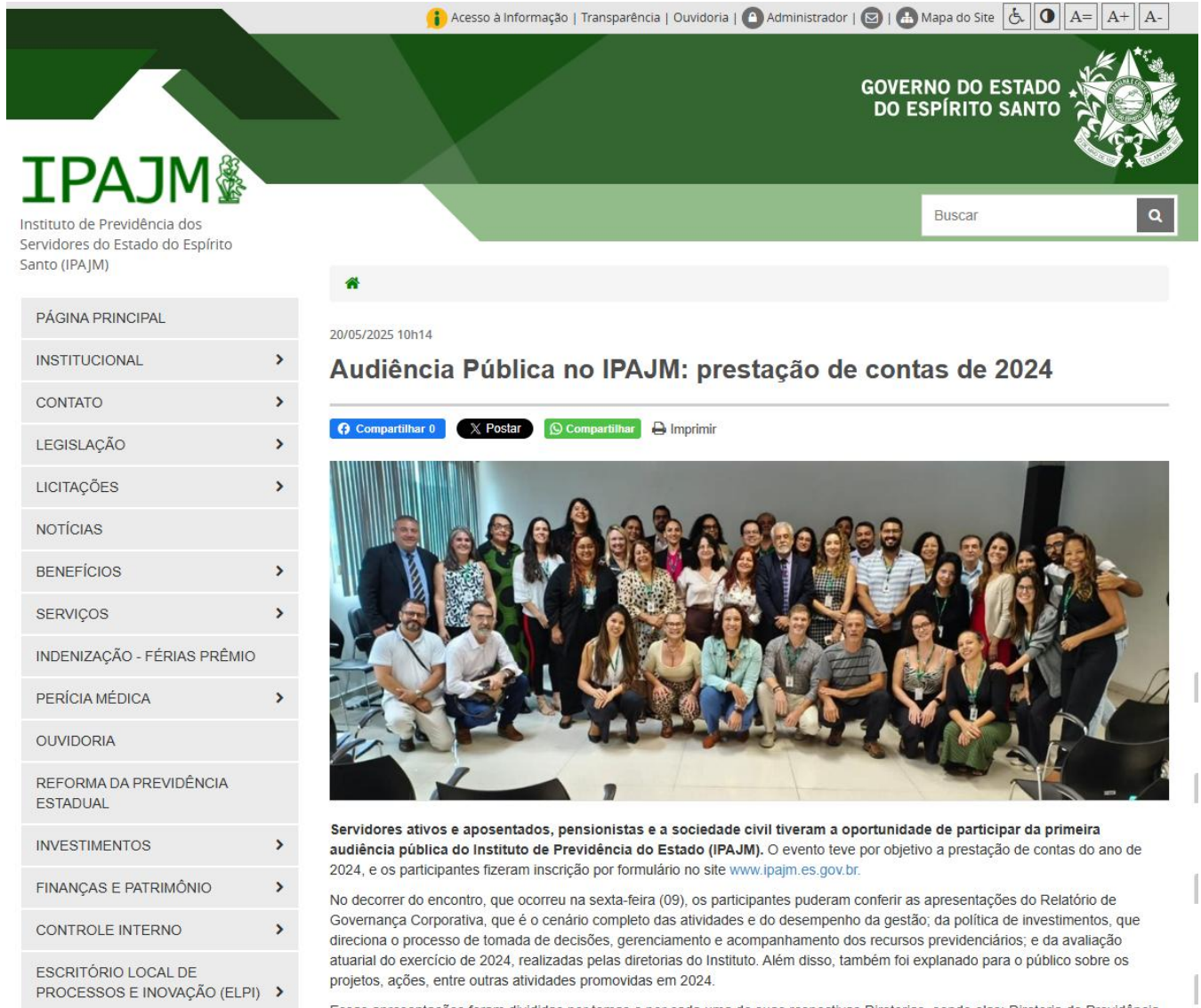
Figura 5 Audiência Pública no IPAJM: prestação de contas de 2024.

Na ocasião, foram apresentados o Relatório de Governança Corporativa, a Política de Investimentos e a Avaliação Atuarial.