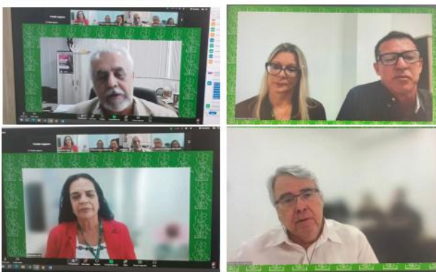
Figura 2 Workshop online do IPAJM sobre Acidente de Trabalho reúne mais de 100 participantes.

Igualmente, a Doença Ocupacional na referida lei, em seu art. 136 é conceituada como "aquela que possa ser considerada consequente as condições inerentes ao serviço ou a fatos nele ocorridos".