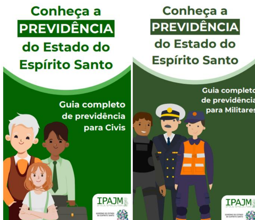
Figura 4 Cartilhas do IPAJM.

Em 03/08/2025 foi realizada consulta no site do IPAJM, onde foi localizado partir do menu principal o acesso às cartilhas 28 que tratam de temas relacionados tanto ao Regime Próprio de Previdência Social (RPPS) quanto ao Sistema de Proteção Social dos Militares, ambos sob a gestão do Instituto.