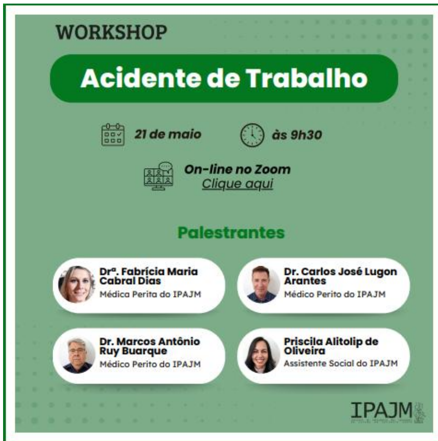
Figura 1 Convite para participação no Workshop sobre acidente de trabalho.