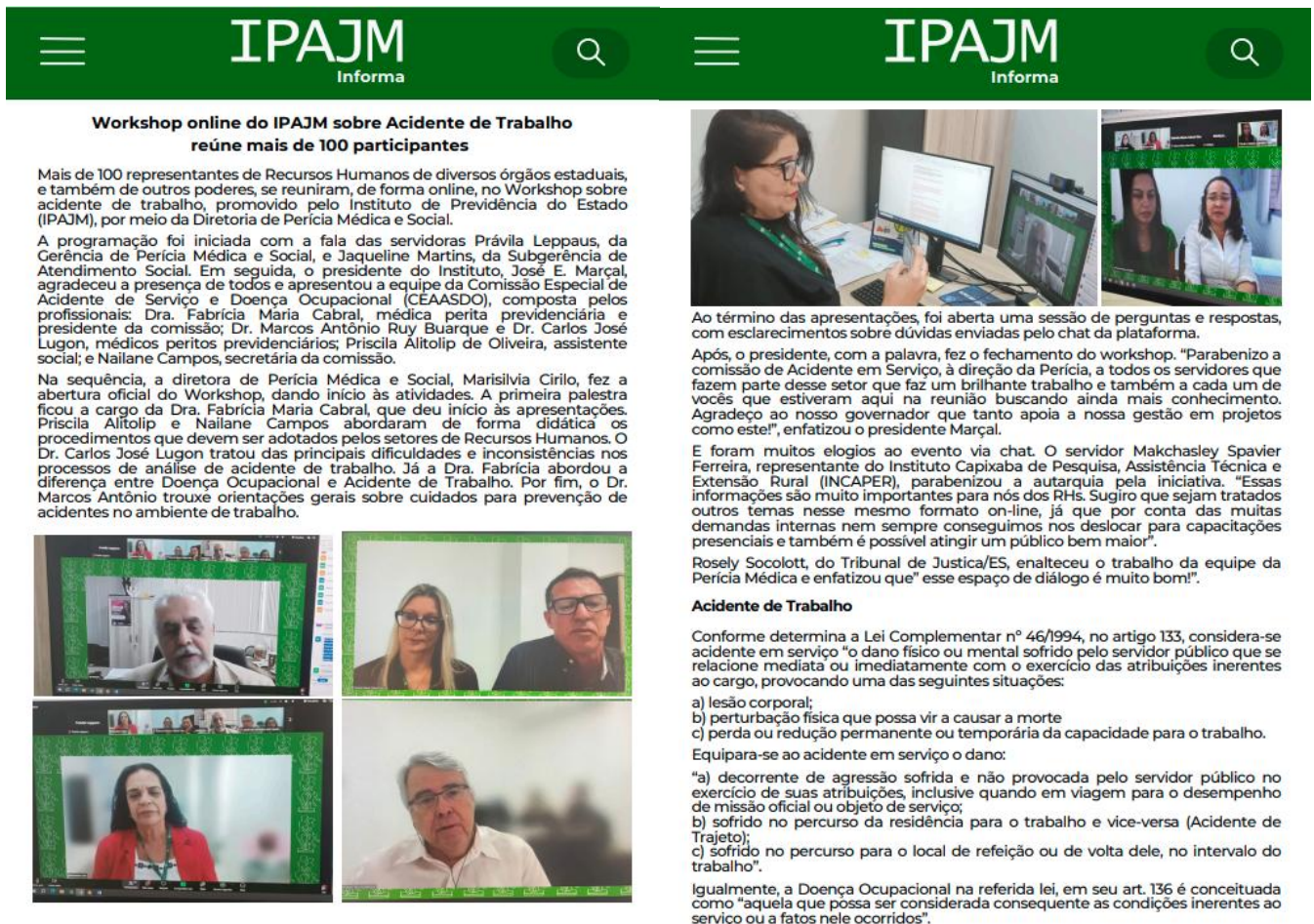
Figura 2 Workshop online do IPAJM sobre Acidente de Trabalho reúne mais de 100 participantes.