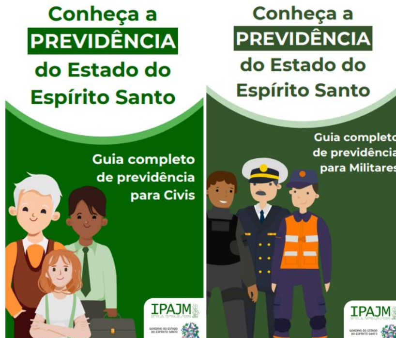
Figura 4 Cartilhas do IPAJM.

Em 03/08/2025 foi realizada consulta no site do IPAJM, onde foi localizado partir do menu principal o acesso às cartilhas 31 que tratam de temas relacionados tanto ao Regime Próprio de Previdência Social (RPPS) quanto ao Sistema de Proteção Social dos Militares, ambos sob a gestão do Instituto.